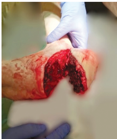
Рис. 1. Вид раны до операции

Под комбинированной спинально-эпидуральной анестезией в положении на спине выполнена срочная операция: «Реплантация заднего отдела правой стопы в объеме первичной хирургической обработки открытого перелома пяточной и таранной костей правой стопы, реанастомоза задней большеберцовой артерии, открытой репозиции перелома пяточной кости, металлоостеосинтеза канюлированными винтами с шайбами под контролем электронно-оптического преобразователя (ЭОПа)».