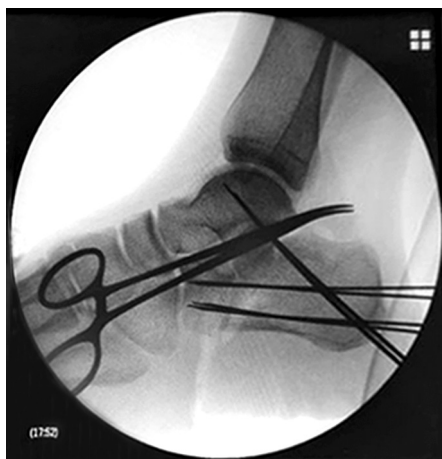
Рис. 4. Контрольная рентгенограмма правой стопы в боковой проекции во время операции после открытой репозиции и остеосинтеза направляющими спицами Киришнера отломков пяточной кости