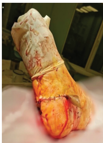
Рис. 6. Вид раны после операции