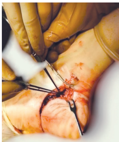
Рис. 3. Вид раны во время операции после реконструкции задней большеберцовой артерии

При контрольном общем анализе крови от 30.10.20 г. диагностирована постгеморрагическая анемия средней степени тяжести: эритроциты 2,8 \times 10^{12}/л , гемоглобин 87 г/л, лейкоциты 11,9 \times 10^9/л , гематокрит 25,4 %, тромбоциты 193,0 \times 10^9/л .