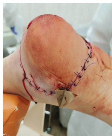
Рис. 7. Вид раны в 1-е сутки после операции