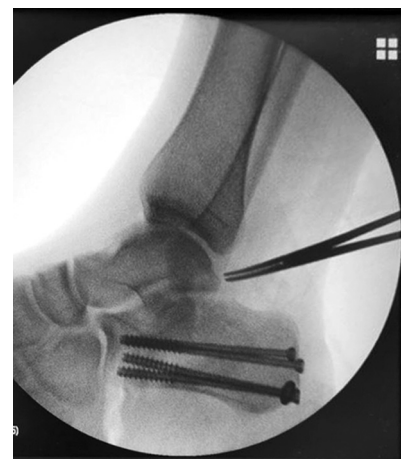
Рис. 5. Рентгенограмма правой стопы в боковой проекции после операции