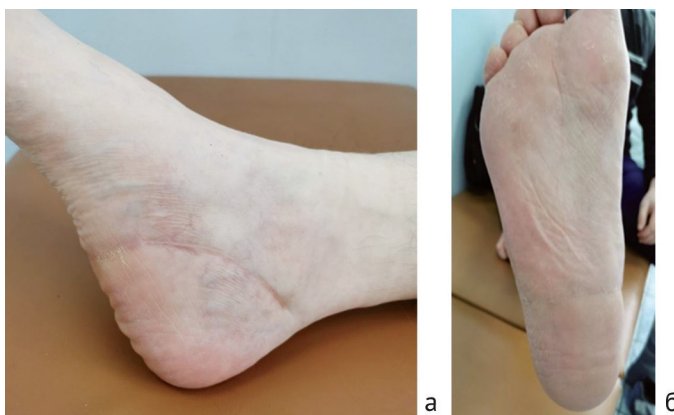
Рис. 9. Фото правой стопы через 5 мес. после операции: а – медиальная поверхность; б – подошвенная поверхность