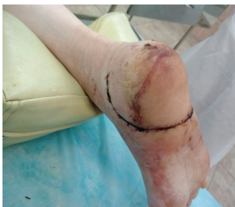
Рис. 8. Вид раны на 21-е сутки после операции

На компьютерной томографии правой стопы через 5 месяцев после травмы определяется сросшийся перелом пяточной кости, металлоконструкции стабильны (рис. 10).