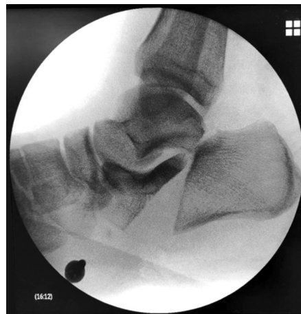
Рис. 2. Рентгенограмма правой стопы в боковой проекции до операции